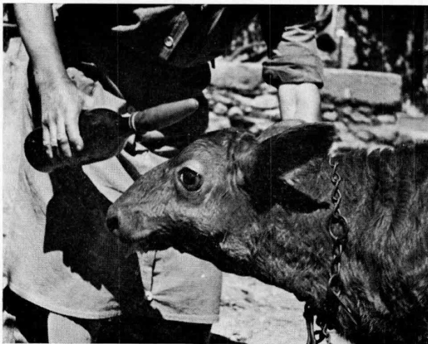
FIG. 3. — Un certain nombre de veaux à « tête de mouton » ont pu être élevés et commercialisés comme veaux de boucherie dans la zone du centre de Soual

Au centre de Soual en 1958 et 1959 Charmant a fourni 16 100 inséminations premières. Si l'on admet le pourcentage de réussite de 77,5 p. 100 du tableau 3 et la demi-pénétrance de 4,6 p. 100 \left(\frac{44}{973}\right) dans ce type de détection, le nombre des anormaux nés ou avortés de Charmant aura été de 564. Dans le même temps, les autres taureaux limousins réalisaient 86 239 I.A. premières. En admettant même qu'il ne naisse qu'un seul veau pour 2 inséminations premières (ce qui compense et au delà le fait que nous avons négligé les pertes embryonnaires précoces dont la portée financière est beaucoup moins grande que celle des avortés et des anormaux viables pour un temps) le pourcentage des veaux anormaux, avortés ou nés au centre de Soual aurait été de 1 p. 100 environ des veaux avortés ou nés de pères limousins au cours de ces deux années. Cela nous donne une estimation par excès des pertes puisque, malgré leur infirmité un certain nombre de veaux « tête de mouton » ont pu être élevés et commercialisés comme veaux de lait (fig. 3). Cette proportion n'excède toutefois pas 70 p. 100 et sans doute même pas 50 p. 100